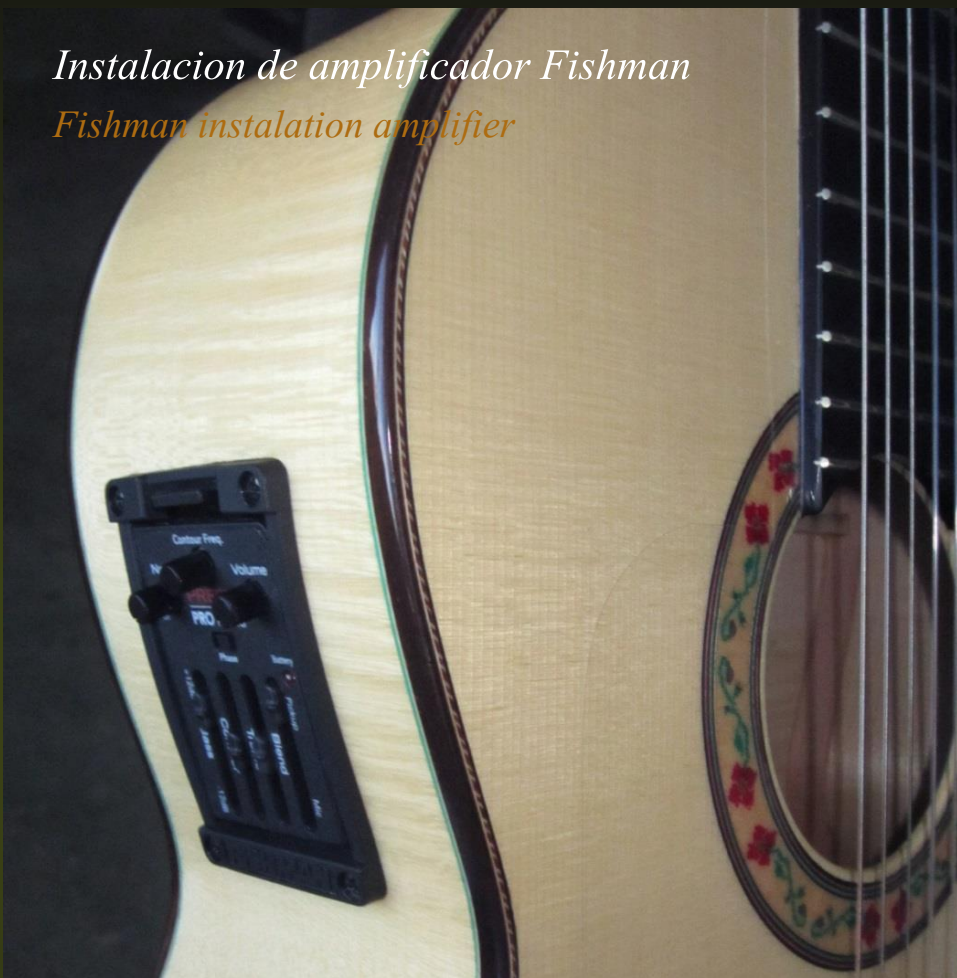
Instalacion de amplificador Fishman Fishman instalation amplifier