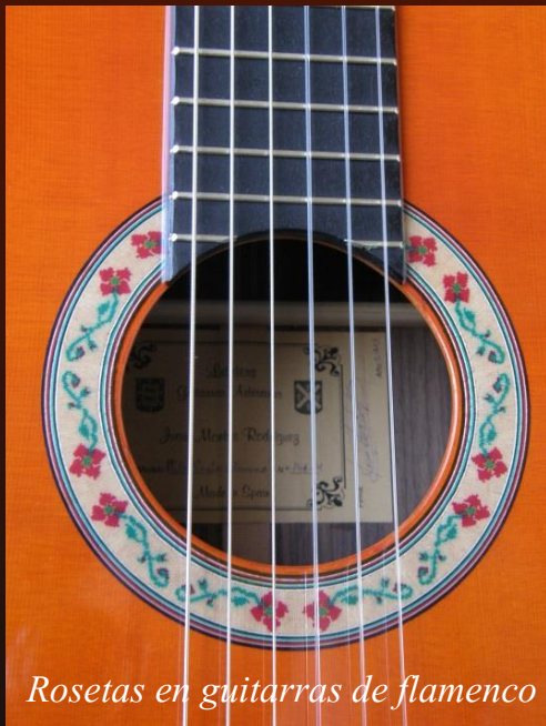
Rosetas en guitarras de flamenco color especial amarillo y naranja