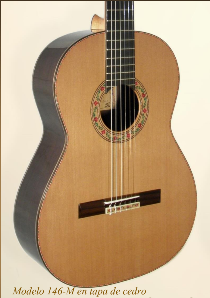
Modelo 146-M en tapa de cedro