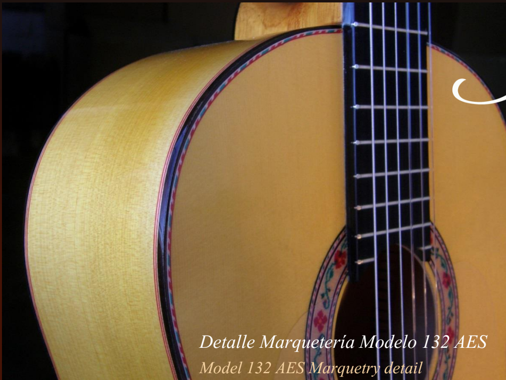
Detalle Marquetería Modelo 132 AES Model 132 AES Marquetry detail