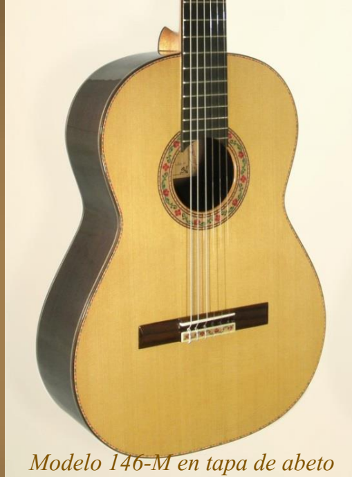
Modelo 146-M en tapa de abeto

Todos los modelos clásicos tienen la opción de fabricarse con tapa de abeto o cedro.