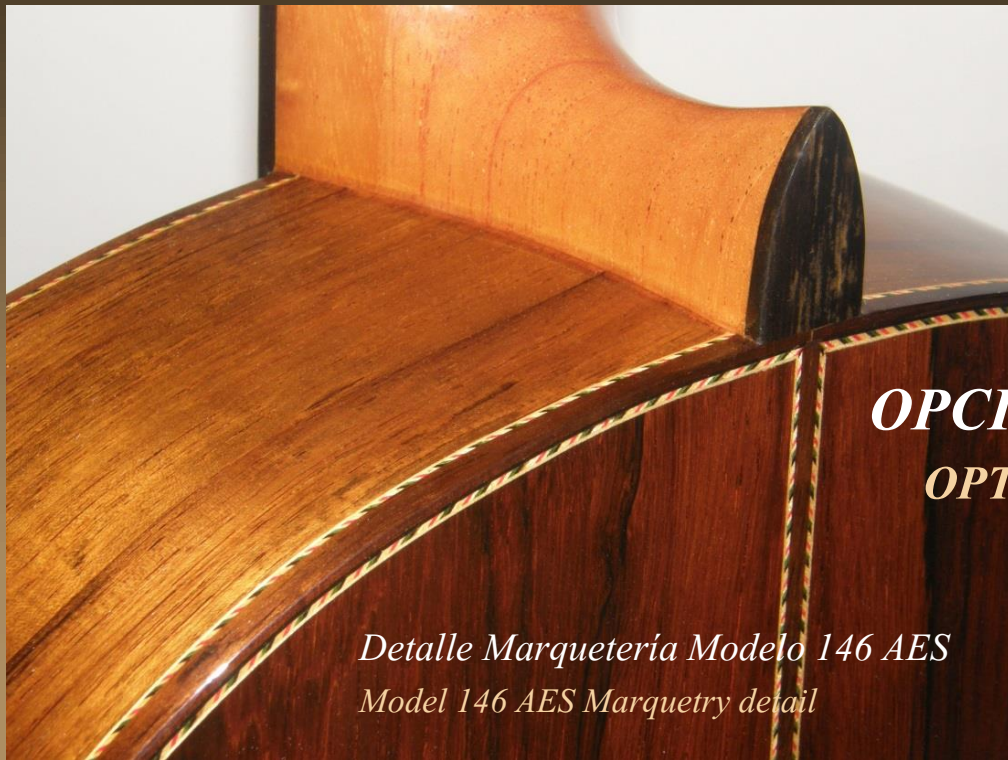
Detalle Marquetería Modelo 146 AES Model 146 AES Marquetry detail