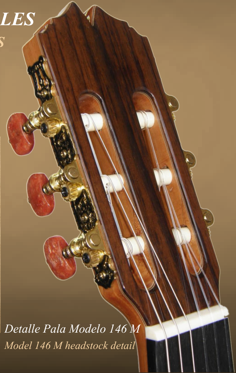
Detalle Pala Modelo 146 M Model 146 M headstock detail