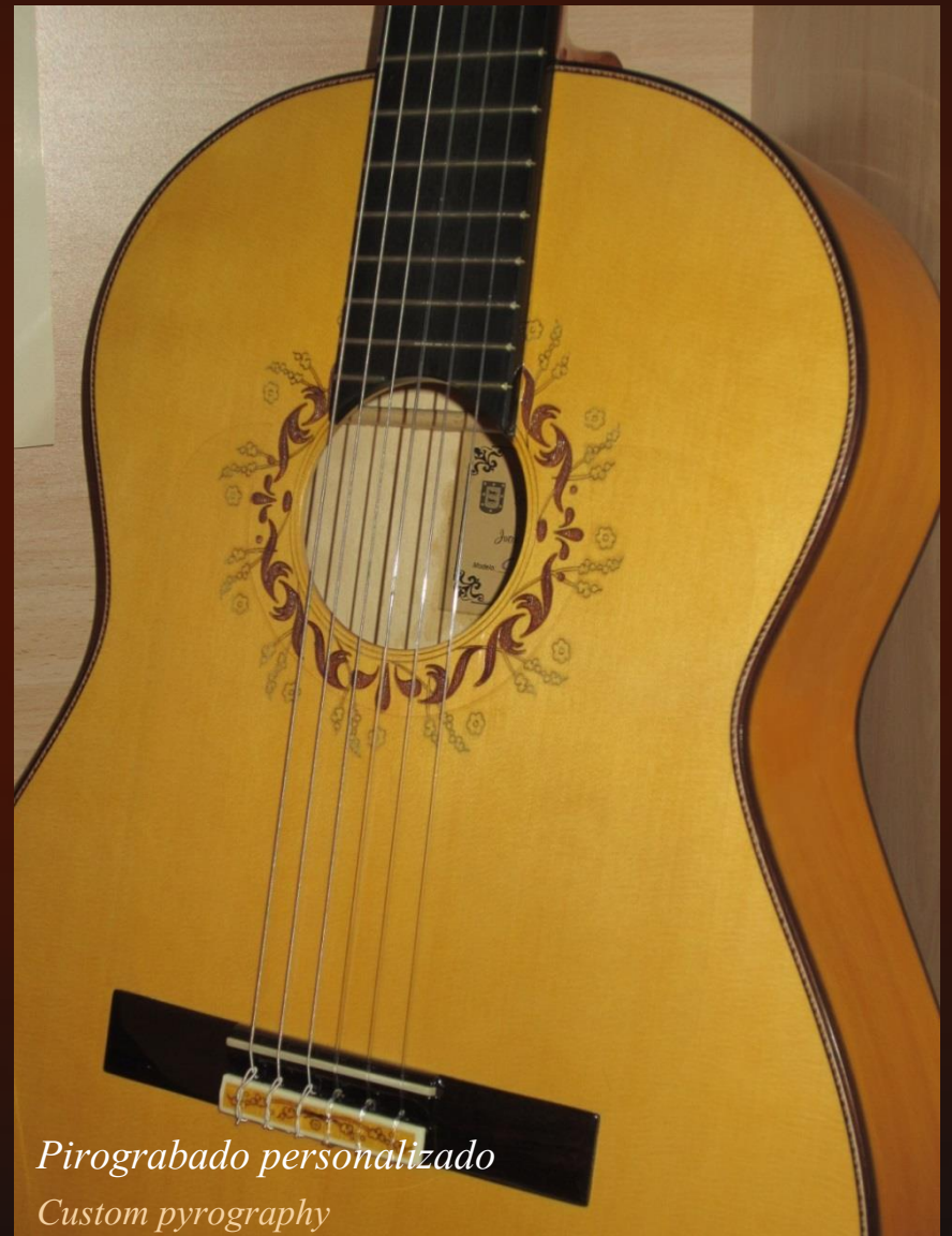
Pirograbado personalizado Custom pyrography