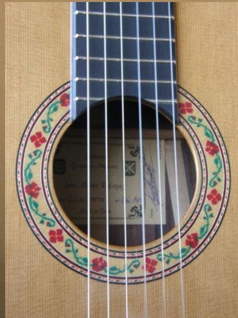
Detalles de bocas decorativas de marquetería: Modelos 147-M abeto, 135-MC y 146 AES Marquetry decorative details: Models 147-M spruce, 135-MC and 146 AES